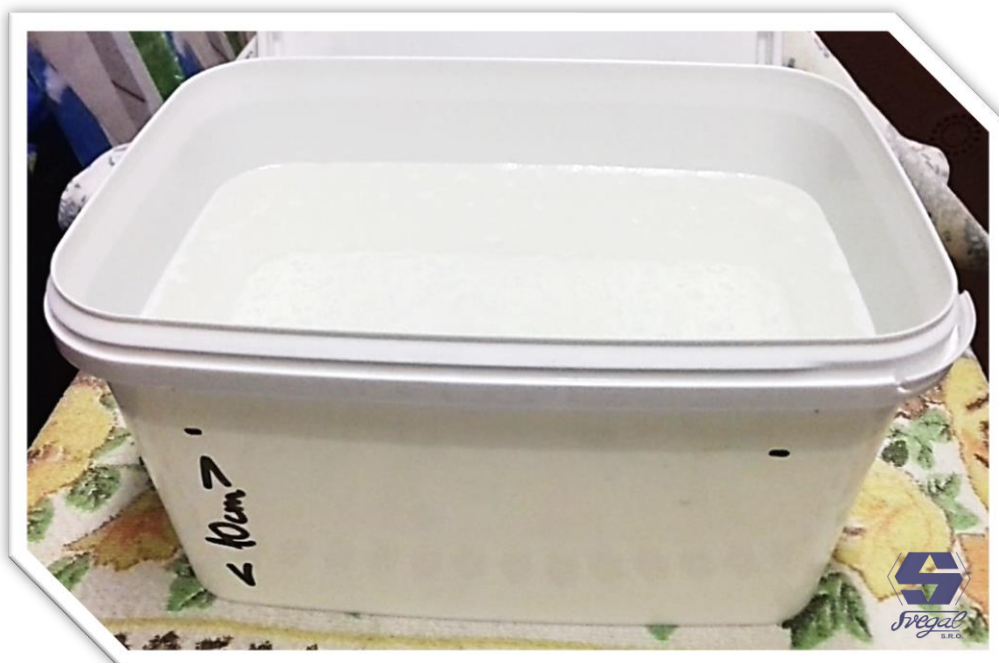
Odlievanie väčšieho objemu živice na jeden krok

Ako forma nám poslúžila plastová nádoba o vnútorných rozmeroch 18 cm x 26 cm. Odlievali sme do výšky 10 cm. Kompletným spracovaním živice Art Resin UV sa zaoberá náš e-book: Art Resin UV Ako s ním pracovať . Faktom je že na odliatie sme použili 4,5 litra natuženej živice. Teplota materiálu aj miestnosti bola takmer ideálna 20°C. Sami sme boli zvedaví ako tento pokus dopadne. Totižto viacero erudovaných výrobcov „epoxidových stolíkov“ nám tvrdilo, že takú zalievaciu živicu, ktorá by vydržala tento pokus bez vyvretia ešte nevideli.