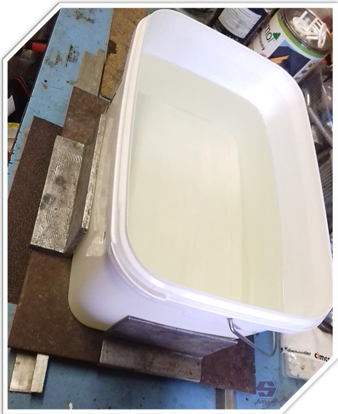
Chladienie odliatku zalievacej živice Art Resin UV

Náš test nám mnohé veci objasnil. Tento typ epoxidovej živice skutočne tuhne pri minimálnej exotermickej reakcii, čoho dôkazom sú vyrobené odliatky rôznej hrúbky. Na priebeh tejto reakcie vplyvajú dva hlavné faktory: teplota a hrúbka vrstvy odlievania v závislosti od rozloženia objemu odlievaného materiálu . Úpravou týchto faktorov môžeme dosiahnuť slušné výsledky aj pri hraničných hodnotách zalievacej živice Art Resin UV.